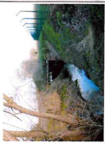
Foto 1 - vorhandener Durchlass